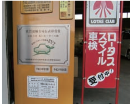
運輸支局長表彰プレート